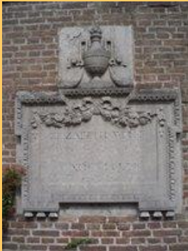
Het graf op de begraafplaats in Scheveningen

Wolff stierf in Den Haag; enkele dagen na haar overlijden stierf ook Deken. Beide vrouwen liggen begraven op de begraafplaats Ter Navolging in Scheveningen.