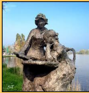
een bronzen beeld van een zittende en staande vrouw, die gezamenlijk een boek lezen (van H. Bayens)