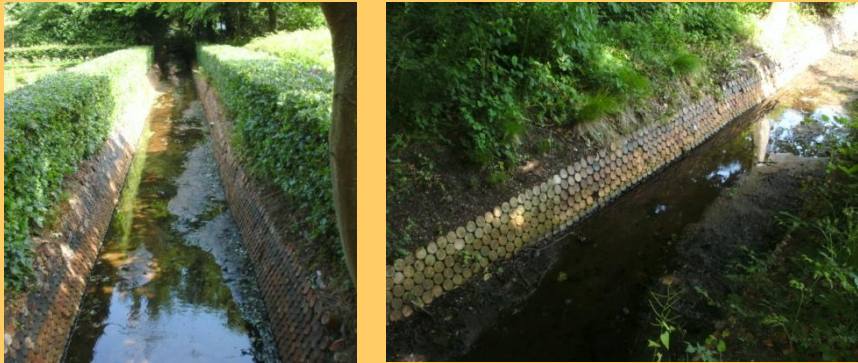
De Scheybeek of Kruikenbeek

tussen Velsen en Beverwijk in 1818 kwam het voordien bij Velsen behorende gedeelte van de buitenplaats bij Beverwijk.